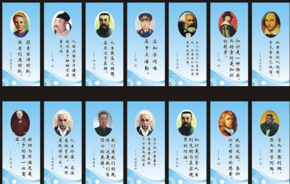
品名：学校教育展板 内容：名人名言 规格：45+100CM

更多 在线阅览 请访问 https://www.wtabcd.cn/zhishi/list/91_0.html