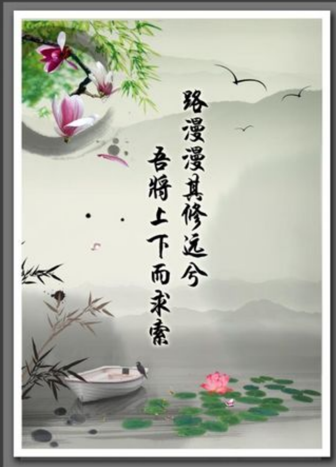
高清图PSD分層源文件 校園文化展板設計

更多 在线阅览 请访问 https://www.wtabcd.cn/zhishi/list/91_0.html